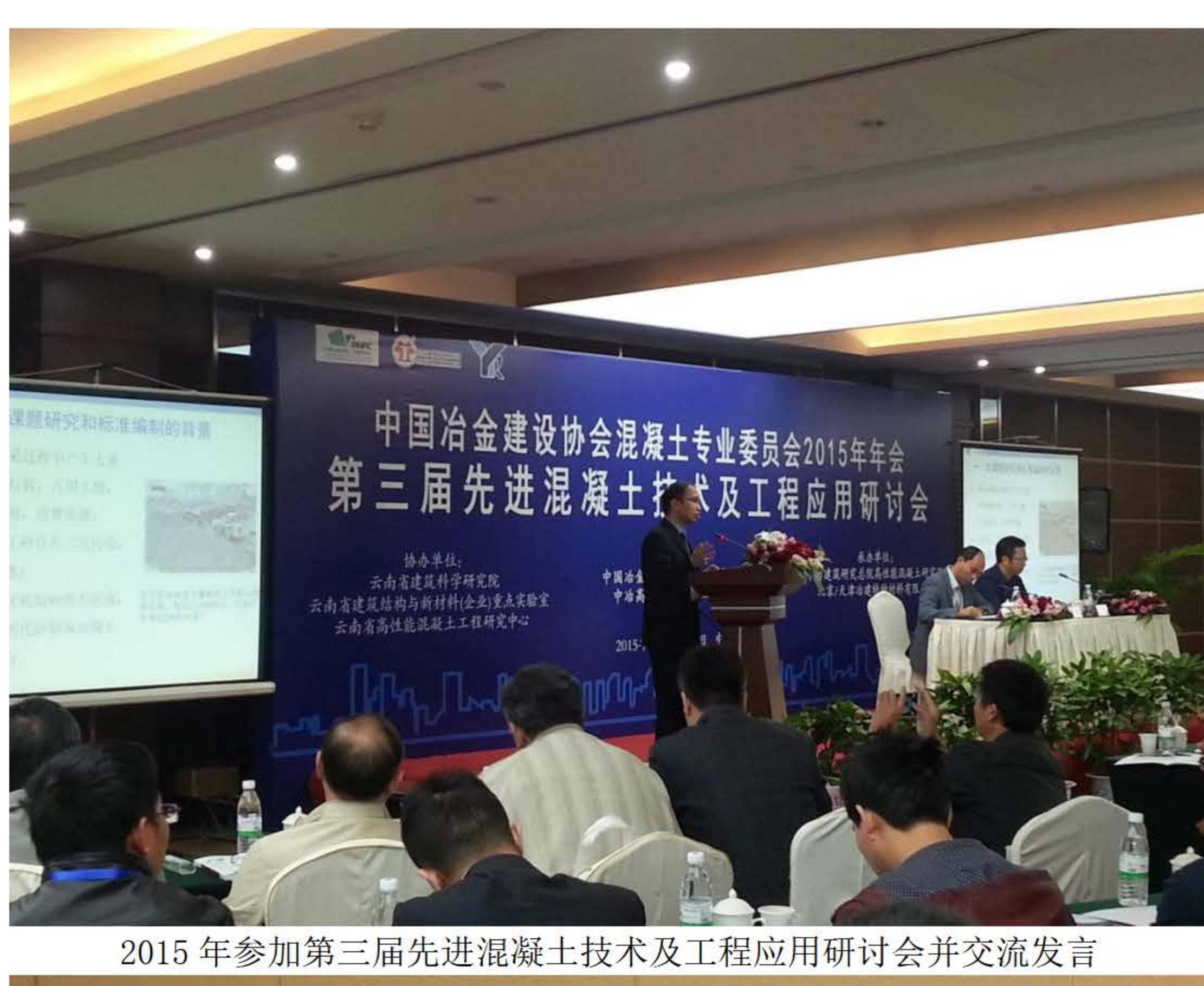
2015年参加第三届先进混凝土技术及工程应用研讨会并交流发言