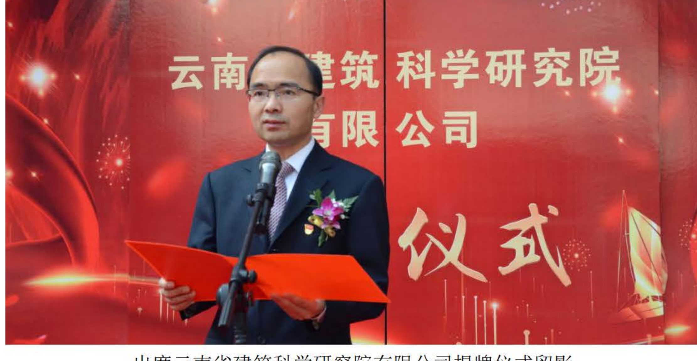
出席云南省建筑科学研究院有限公司揭牌仪式留影