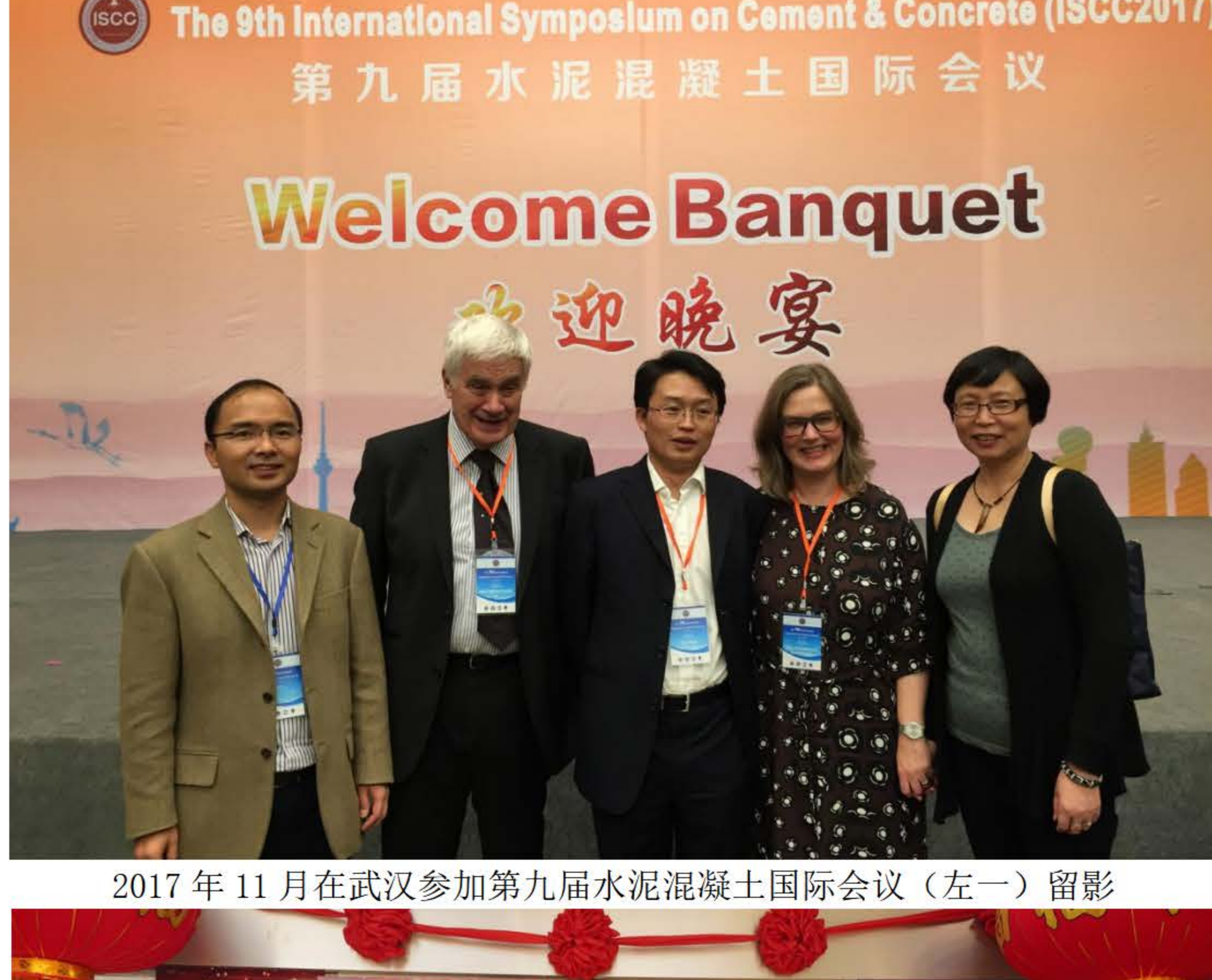
2017年11月在武汉参加第九届水泥混凝土国际会议（左一）留影