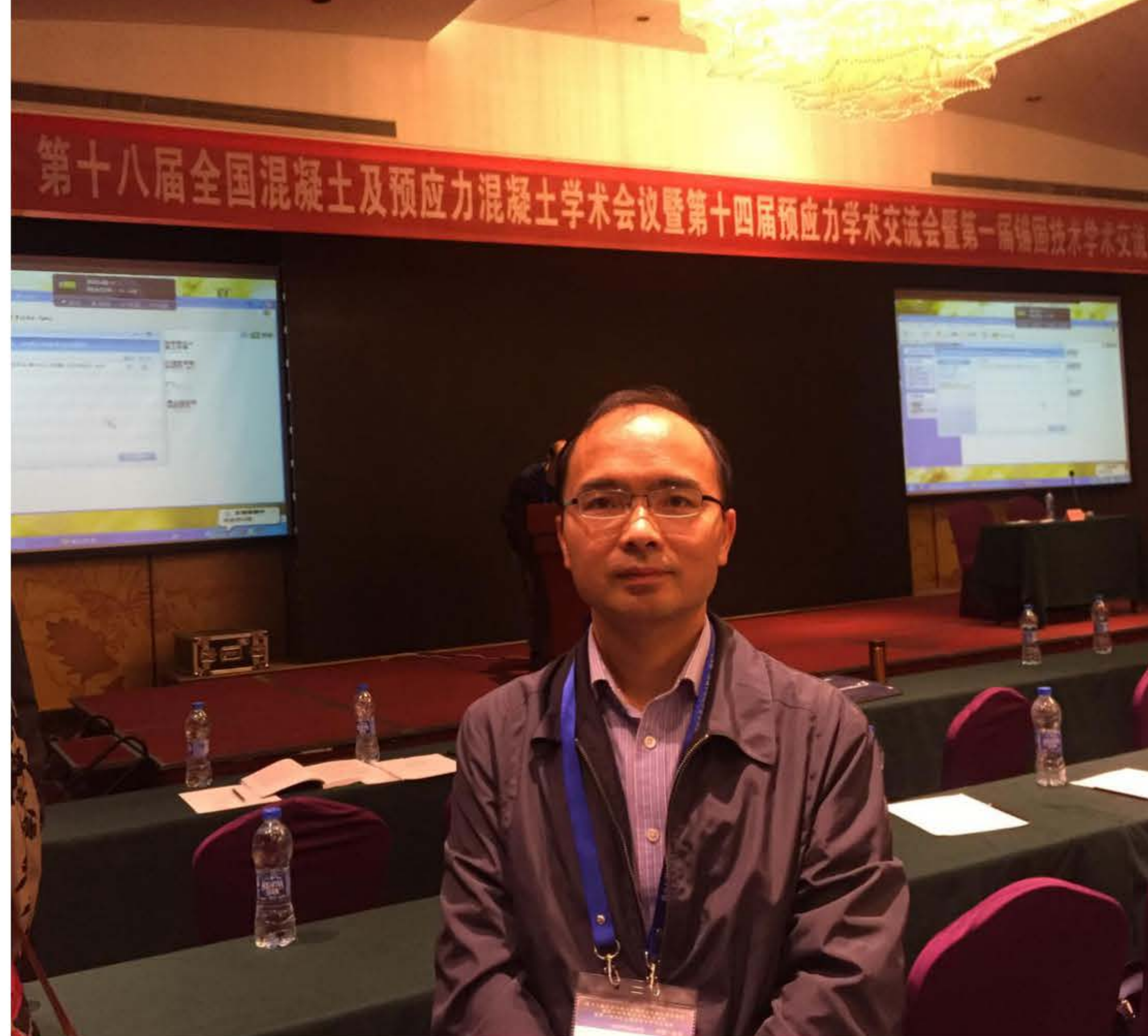
2017年10月在杭州参加第十八届全国混凝土及预应力混凝土学术会议暨十四届预应力学术交流会暨第一届锚固技术学术交流会留影