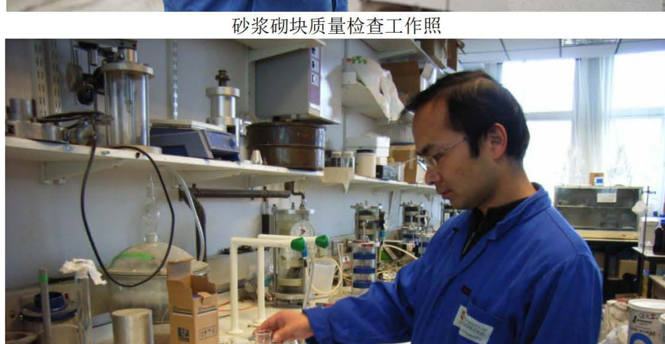
在剑桥大学进行试验工作照