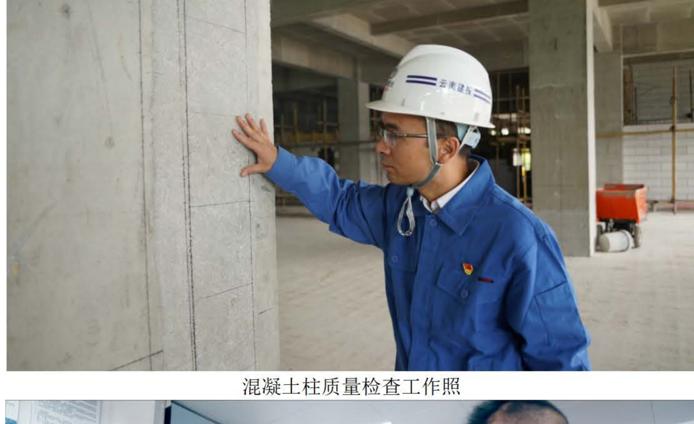
混凝土柱质量检查工作照