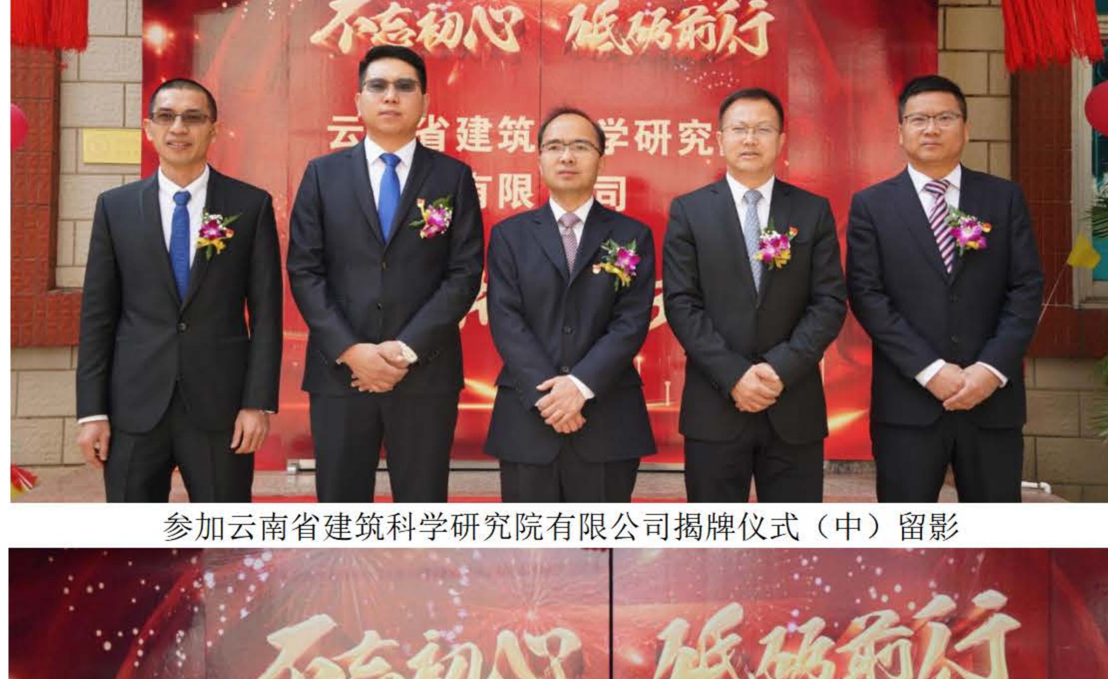
参加云南省建筑科学研究院有限公司揭牌仪式（中）留影