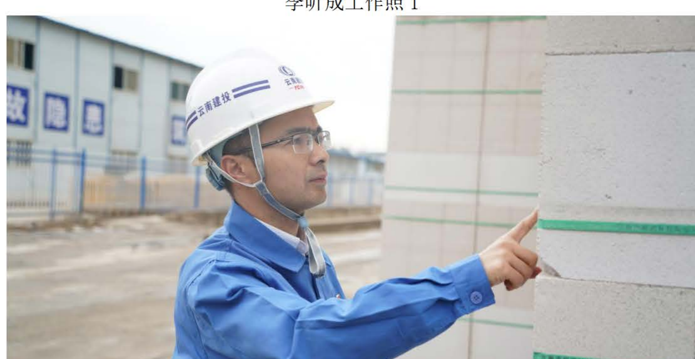
砂浆砌块质量检查工作照