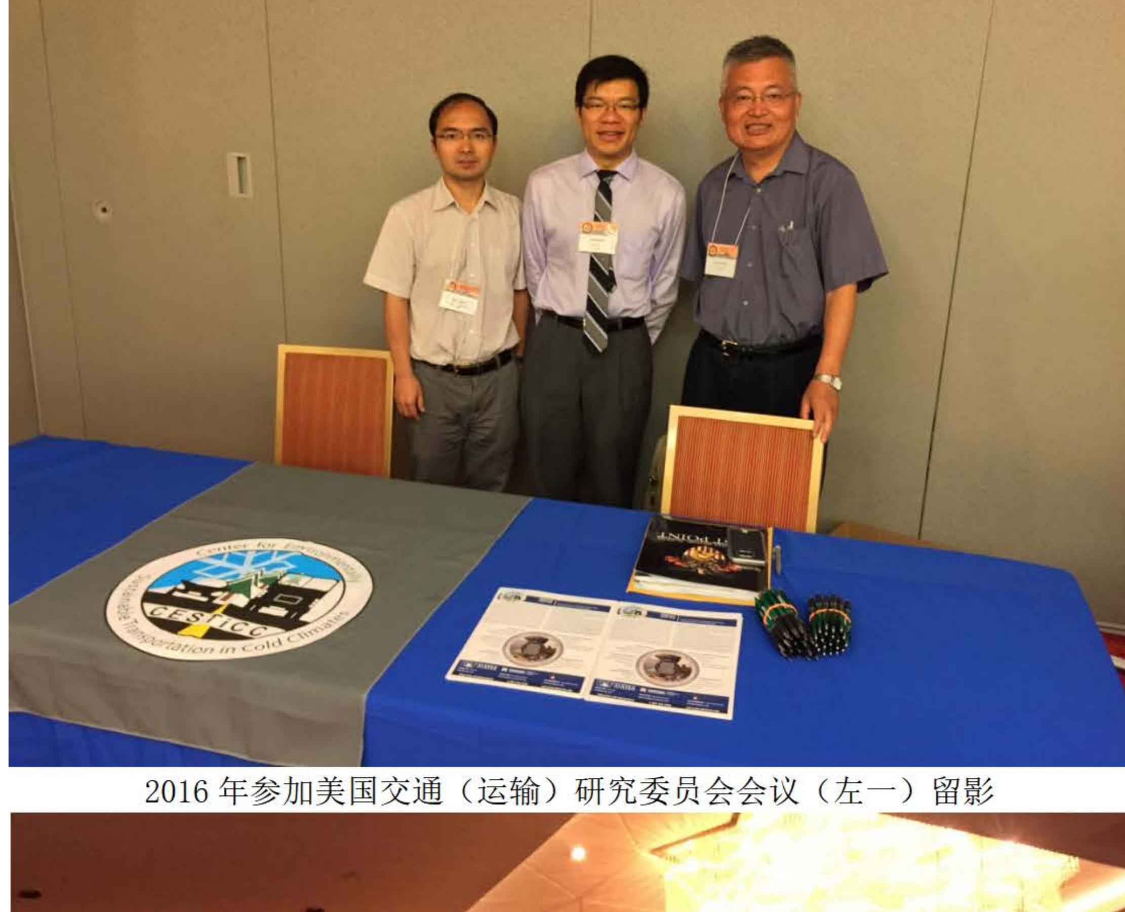
2016年参加美国交通（运输）研究委员会会议（左一）留影